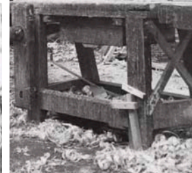
3)1946. Un simpatico saluto dal collega Cussino che ha inviato le foto di cui sopra.

Al bravo Ernesto a mi corso di tante faticate alla "Triennale di Napoli" del 1940 Cussino